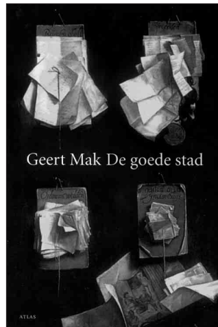
Geert Mak De goede stad