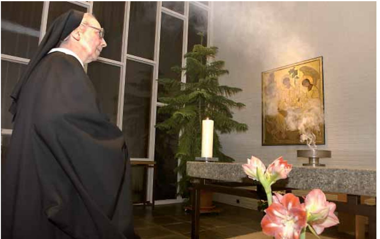
Wierook bij het avondgebed. Deze traditie in de abdij van Bonheiden gaat terug op een psalmtekst.

„Maar het is een grote steun als je het gebed samen kunt bidden”, weet zuster Agnes. „Bovendien kun je Gods lof - wat dit gebed uitdrukkelijk wil zijn - eigenlijk niet anders dan zingen. De psalmen moeten het keelgat uit”, zo verwoordde iemand het heel treffend. Ieder neemt met z'n eigen stem deel aan het ene gebed, maakt het aldus tot één gezamenlijk gebed.”