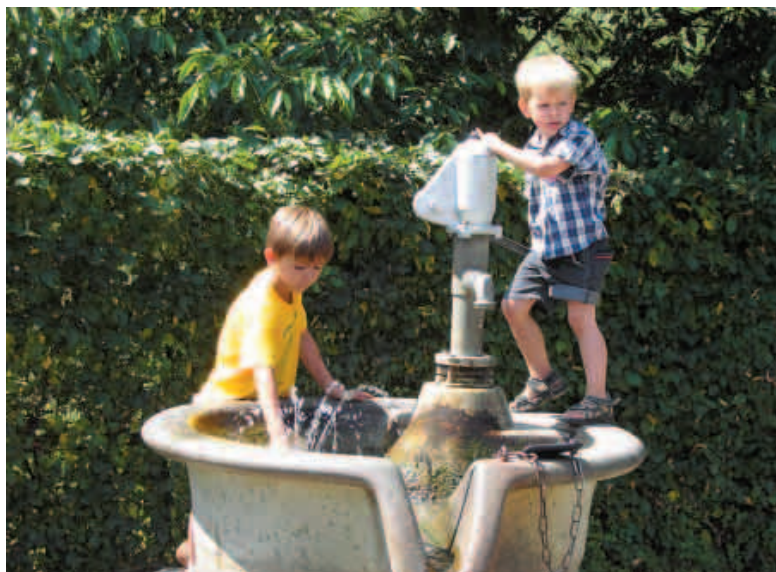
Openbaar terrein blijft aantrekkelijk spelterrein. Toch komt het er minder van.

Nog een reden is misschien dat ze het simpelweg te druk hebben om even op straat te spelen. Kinderen bewegen wel en verkennen de wereld, maar dan wel georganiseerd, in de sportclub of met de