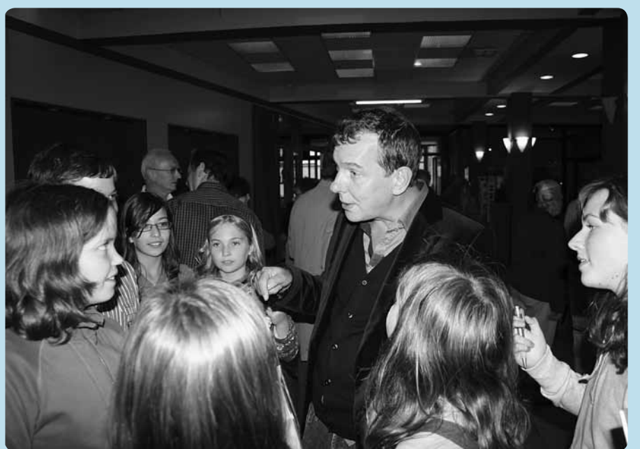
Ook Markske van de kampioenen was er bij. Hij was verrast zo'n jonge reporters van Kerk & Leven te ontmoeten.

Maar het zijn vaak net de zorgen om je rijkdom , die je rusteloos en eenzaam maken. Ook al lijkt het misschien best fijn veel voor jezelf te hebben, wie deelt met wie minder heeft, zal zich ook in zijn hart rijk voelen.