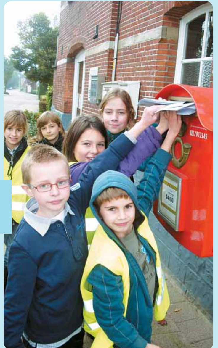
Ook basisschool Baloen in Loenhout post brieven tegen de doodstraf.