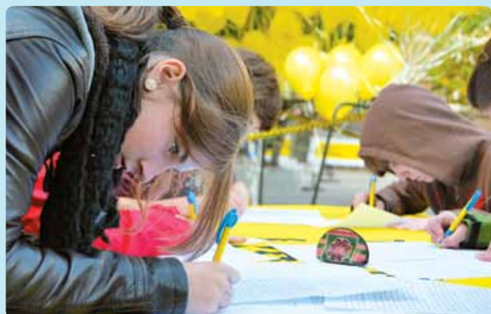
Wie schrijft ze vrij?

nen. Want ik ervaar dat het lot van anderen onze jongeren raakt.”