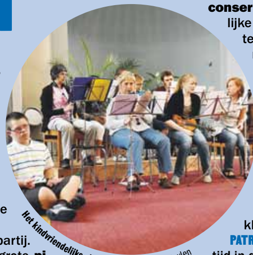
Het kindvriendelijke vieringorkest.

Tijdens de viering klinkt af en toe spon- taan applaus , omdat ANSE jarig is, of omdat ANNE een prachtig lied zingt. Iedereen hoort erbij.