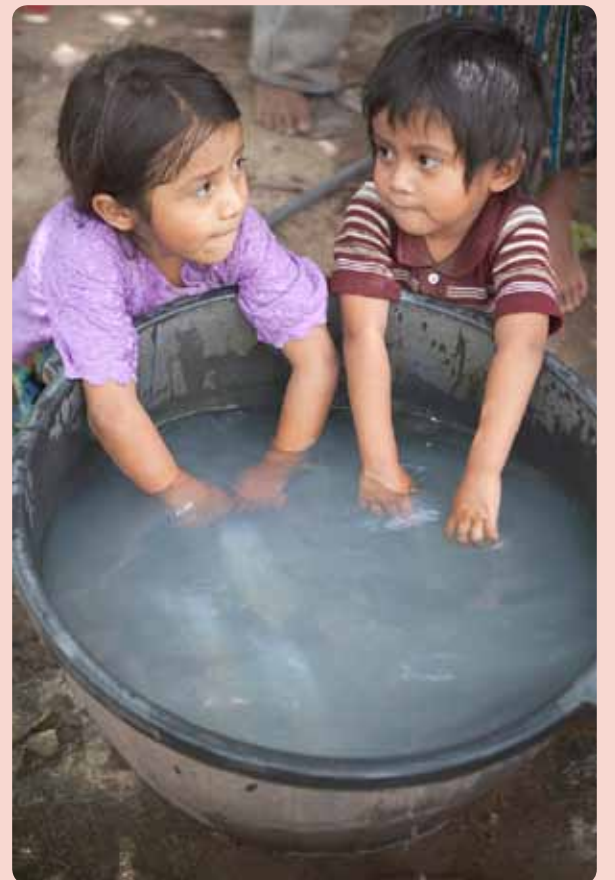
De kinderen zijn het vuile water gewoon.