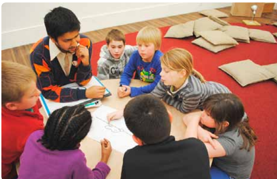
Nadenken, knippen en plakken. Zo wordt een eenvoudig konijntje een kunstwerk.

Tot 3 juni logeert Nijntje in Mechelen. Op meer dan dertig plekje in de stad heeft ze zich verstoppt. De Expo Dick Bruna kan je bezoeken in het Cultuurcentrum, Minderbroedersgang 5 in Mechelen.