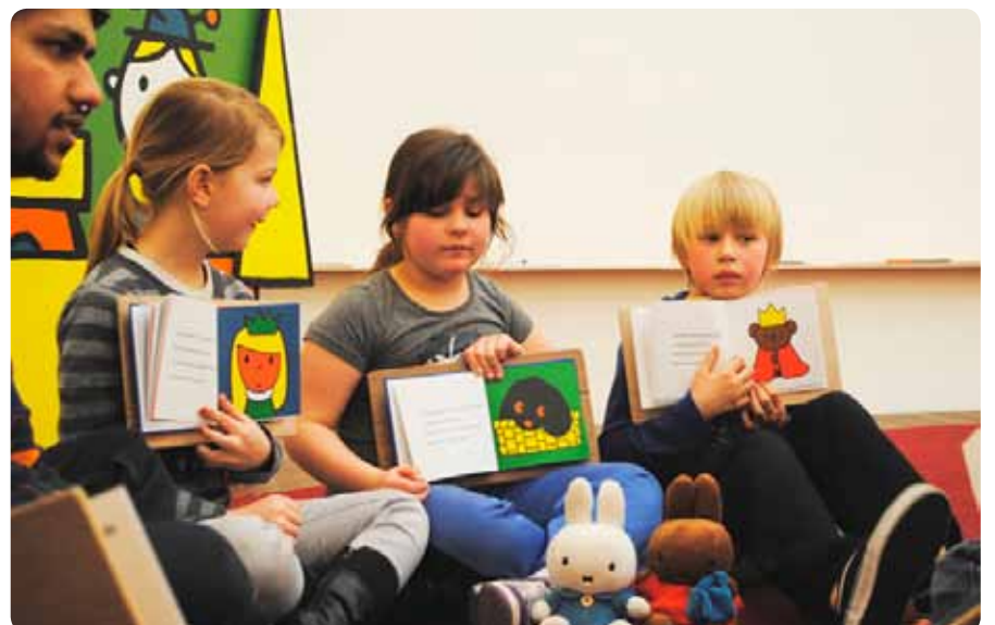
De wereld van Nijntje telt vele vrienden. © MC