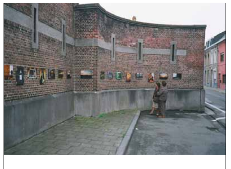
Wie zich moeilijk kan uiten met woorden kan in een creatieve cursus een deel van zichzelf kwijt.

Info op www.derodeantraciet.be of via 016 20 85 10.