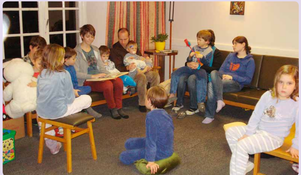
In pyama uitbollen en zachtjes indommelen bij een verhaal. Zalig...

Ook zin in een leuke vakantie in een abdij? Van 15 tot 19 augustus zijn gezinnen welkom in de abdij in Averbode voor een onvergetelijke familievakantie over het Bijbelboek Ruth. Je leest er alles over op www.onthaal-abdijaverbode.be . Een overzicht van alle gezinsvakanties in de zomer vind je op www.gezinspastoraal.be .