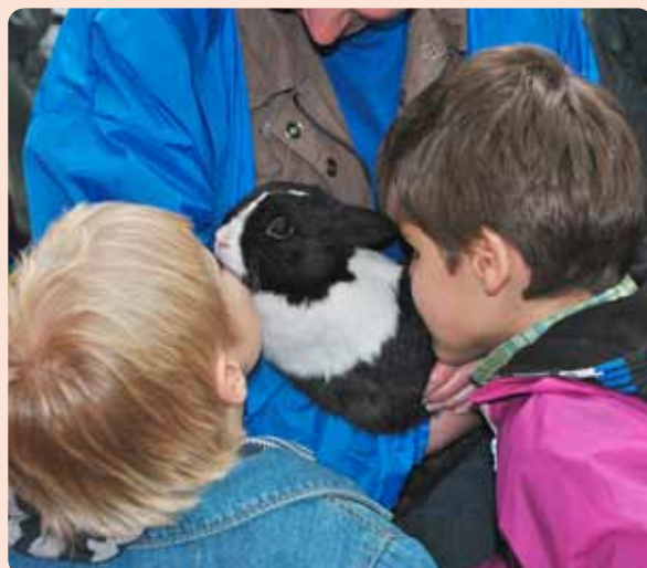
Een dikke zoen als afscheid.