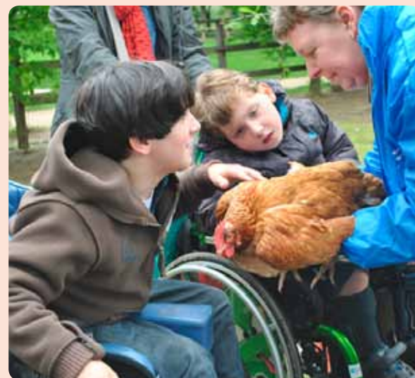
Dag kip met de zachte veren.

school wil? Ja hoor. De kip blijft muistil zitten. „Ze lijkt wel dood”, zegt Wout. Hij aait de veren en geniet. „Dag kip met de bruine veren en de rode kam”, zingt Wout.