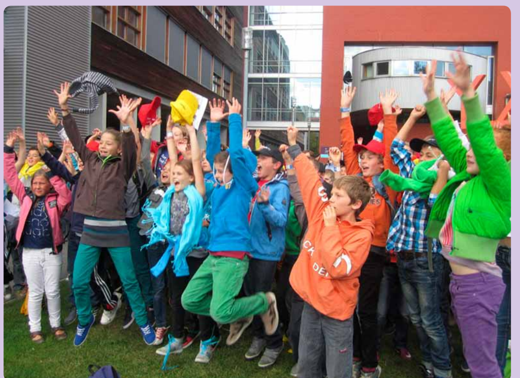
Kleurrijk JA roepen tegen het leven, tegen elkaar en tegen Jezus.