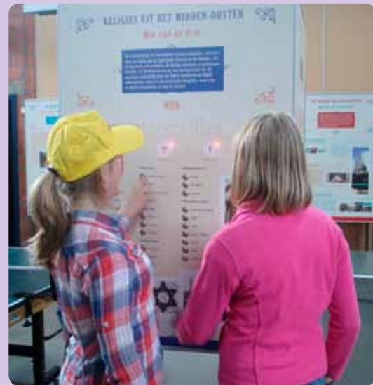
Welke godsdienst viert straks de geboorte van Jezus?