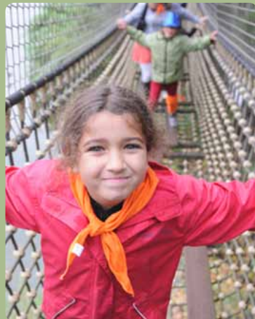
Spannend: stappen op de glibberige balken tussen touwladders hoog in de bomen.

Aan het einde van het avontuur is het tijd voor de prijsuitreiking. Wie heeft de zoektocht volbracht? Drie pluchen apen en drie medailles gaan mee de bus op, na een boeiende dag tussen de dieren.