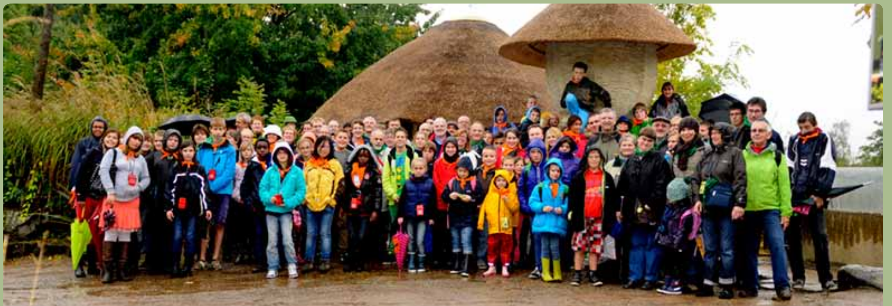
Allemaal blij gezichten, ondanks de miezerige dag.