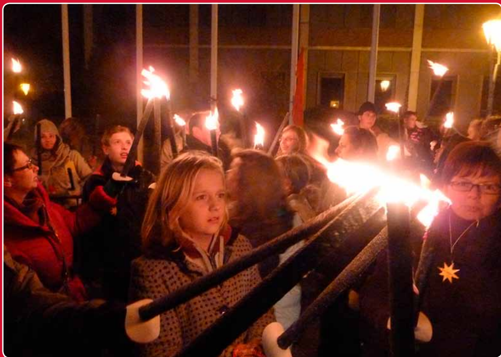
Het vuur brandend houden, maakt alle harten klaar voor Kerstmis.

Hoevel het volop wintert, worden de dagen straks weer een beetje langer. De lente is nog ver weg, maar Kerstmis komt er aan. En dat betekent: licht en warmte, gezelligheid en pakjes onder de boom. Maar Kerstmis is bovenal het feest van Jezus, die licht wil brengen in het hart van mensen.