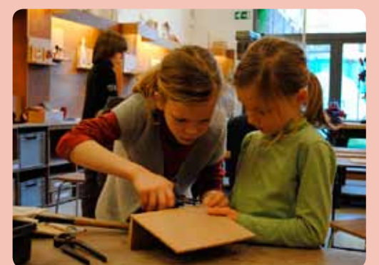
Die nagel moet er weer uit. Houd jij het plankje even voor me vast?