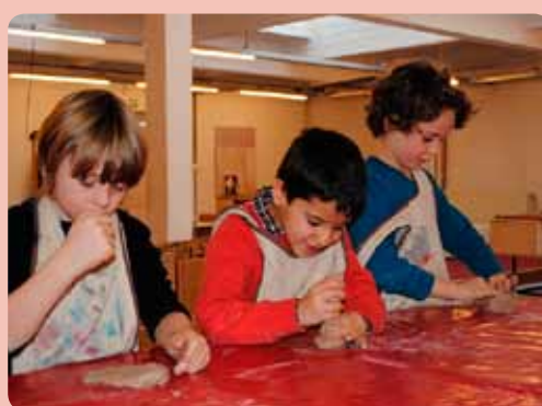
Een kommetje maken in klei, lekker kliederen.