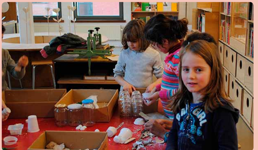
In het ABC-huis valt er altijd iets te beleven.

Wil je ook het ABC-huis ontdekken? Je kunt er terecht met je klas of met het gezin. Kijk even op de website van Art Basics for Children, www.abc-web.be , om te kijken wat er zoal op het programma staat.