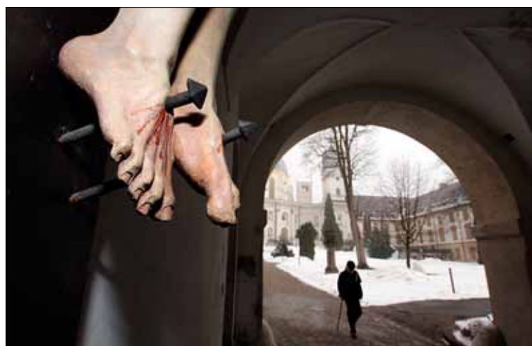
Seksueel misbruik van minderjarigen door geestelijken was in Duitsland vooral te situeren in katholieke scholen.