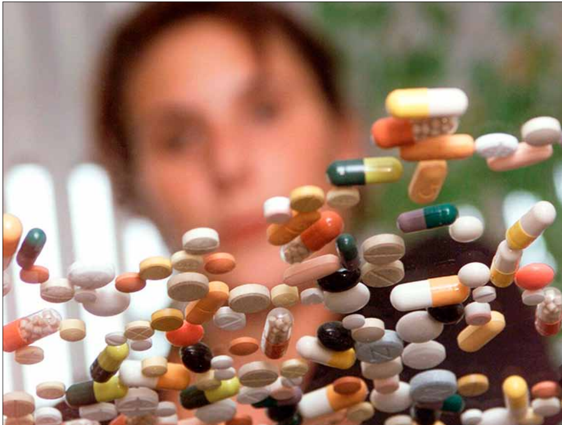
Weeg steeds de voor- en nadelen tegen elkaar af als je medicijnen moet slikken.

Motilium en Voltaren zijn zowat vaste waarden in elke huisapotheek, weet De Smedt. „Velen menen dan ook dat het geen kwaad kan om ze in te nemen zodra je respectievelijk maagklachten of spierpijn hebt. Die mentaliteit wordt in de hand gewerkt door de veelvuldige en vaak verleidelijke publiciteit voor geneesmiddelen. Geneesmiddelen zijn echter geen snoepjes. Ze hebben