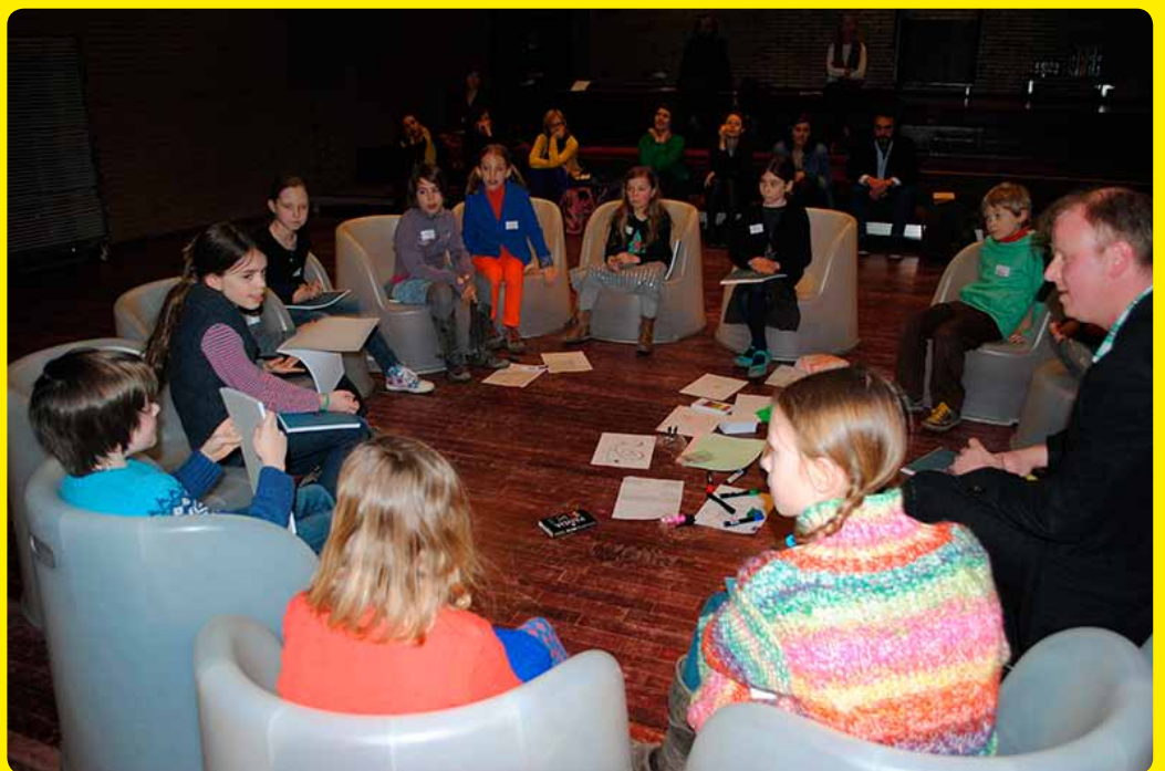
In een actieve workshop zoeken de kinderen naar een vraag die hen bezighoudt.