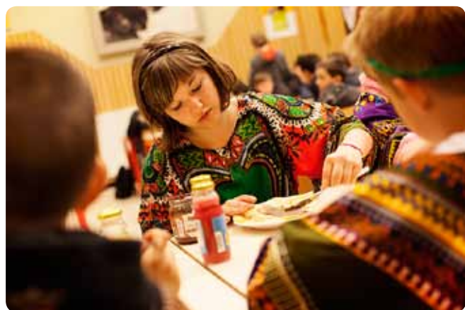
Een (h)eerlijke pannenkoek smaakt dubbel zo goed.