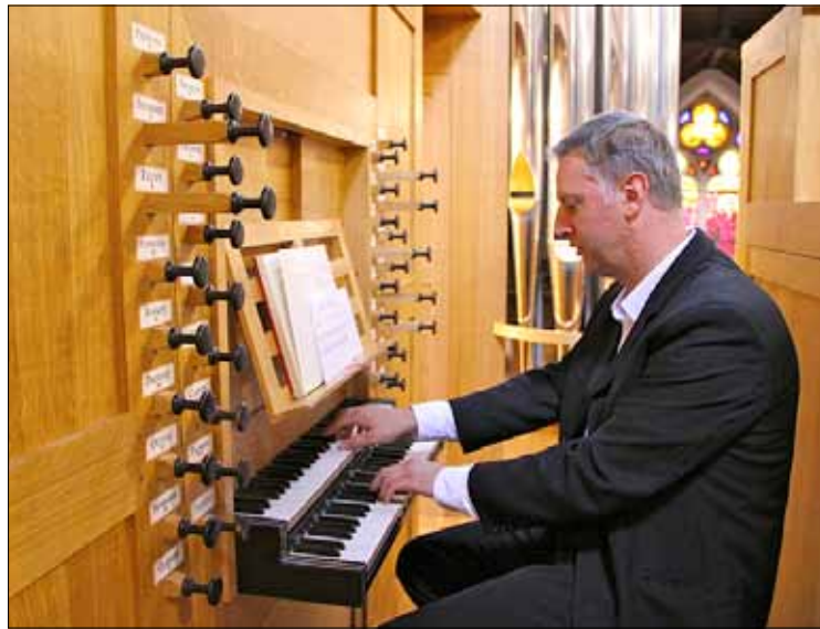
„Als ik speel of zing, moet ik me concentreren, maar achteraf sta ik stil bij de boodschap van de muziek.”