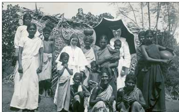
Zusters en paters trokken zich in India ook het lot van de achtergestelde tribale bevolking aan.

Beelden van een vergeten ontmoeting. De Belgische missie in India, 1850-1950 in het KADOC in Leuven (Vlamingenstraat 39), nog tot 25 januari, gratis en elke werkdag van 9 tot 17 uur, op zaterdag van 9 tot 12.30 uur. Gesloten op 25 december tot en met 5 januari. Meer info via 016 32 35 00.