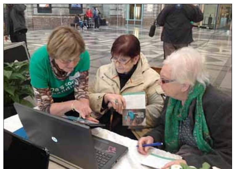
De campagne Da's toch handig, dat internet ging van start in het station Antwerpen-Centraal.

Het internet wordt – ook voor de overheid – dé plek waar informatie wordt aangeboden en opgezocht. De drempelvrees voor computer, smartphone of tablet