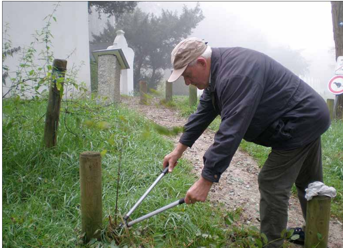
De ‘wandelpeter’ snoeit het groen langs wandelpaden en ‘de kapellekens’ in Mol.