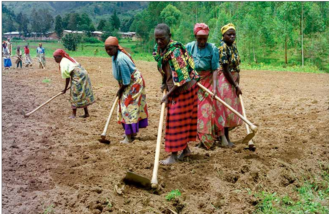
In Rwandese dorpen moeten families van slachtoffers en daders verder met elkaar.

De toestand op het terrein is alvast minder geruststellend. „Onze gemeenschappen tellen gedecimeerde families zowel als gezinnen met familieleden in de gevangenis”, zegt de bisschop. „Al die mensen heb-