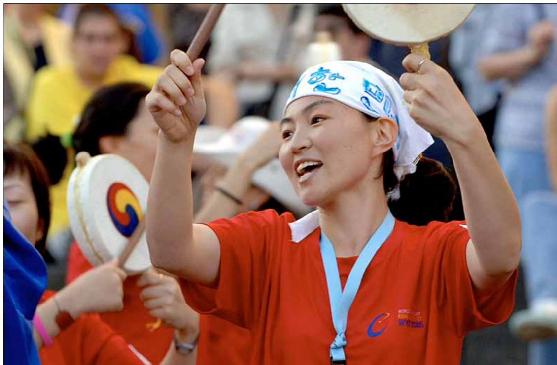
Uitbundige katholieke Koreanen tijdens de jongste Wereldjongerendagen.

Hoe zou Freddy het konijn kijken naar het mensenras? Als medekonijnen? Jacques Derrida beweert dat een dier een mens steeds naakt ziet. Een dier maakt geen onderscheid tussen dure en minder dure kleren, tussen arm en rijk, tussen een geslaagd en een niet-geslaagd leven. In de ogen van Freddy het konijn lopen wij dus allemaal naakt rond. Net als hij.”