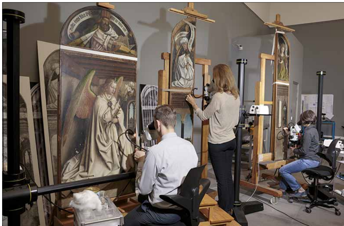
Restorateurs aan het werk: precisie, vakkennis en veel geduld.

Soms schrijft ze me een brief terwijl ze de geiten hoedt. Dat geeft haar duidelijk rust