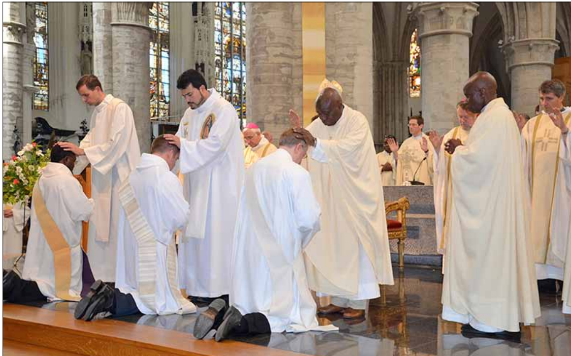
Priesterwijding van drie mannen voor het aartsbisdom Mechelen-Brussel.