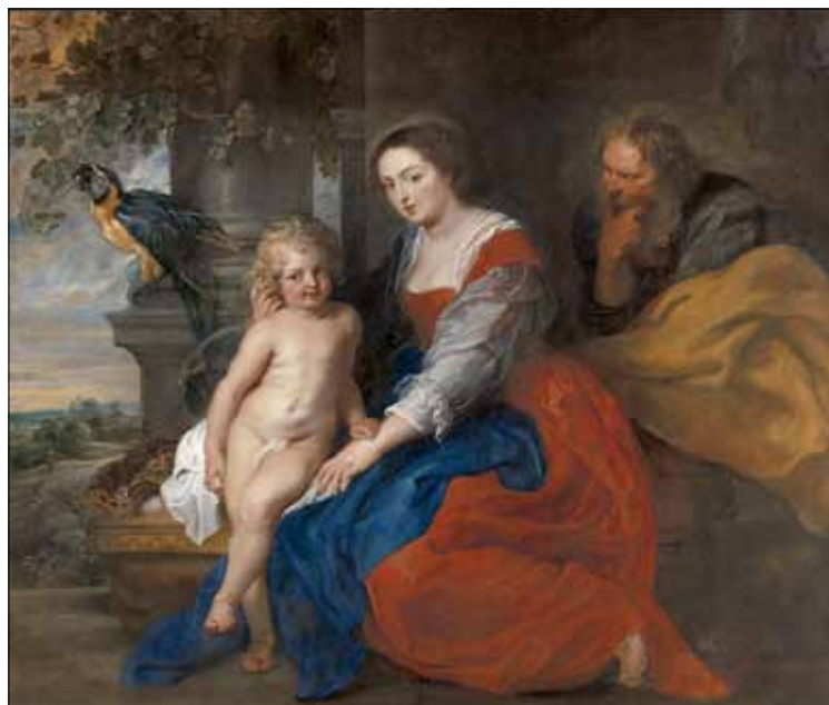
Rubens zelf verbreedde het schilderij en hij voegde er Jozef en de papegaai aan toe.

Donkere kamers. Over melancholie en depressie , nog tot 31 mei 2015 in het Museum Dr. Guislain in Gent (Jozef Guislainstraat 43). Dinsdag gesloten. Meer info: 09 216 35 95 en www.museumdrguislain.be .