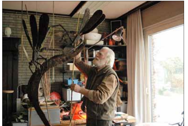
In Timmers' tuin wandelen de Emmaüs-gangers tussen bronzen dieren, zoals de libellen waar de kunstenaar nu aan werkt.

mensen naar boven te trekken. „Sommigen kunnen zijn hand aanraken, terwijl anderen niet zo hoog geraken of te zelfgenoegzaam zijn om omhoog te kijken”, legt hij uit. „Het kruis reikt ech-