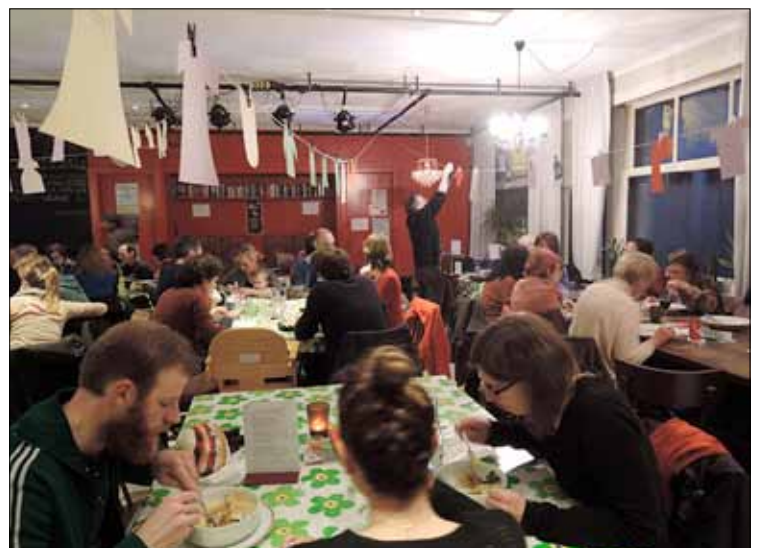
De Verhalenwerf kiest vaak voor een interactieve aanpak. „We blijven niet achter het spreekgestoelte.”