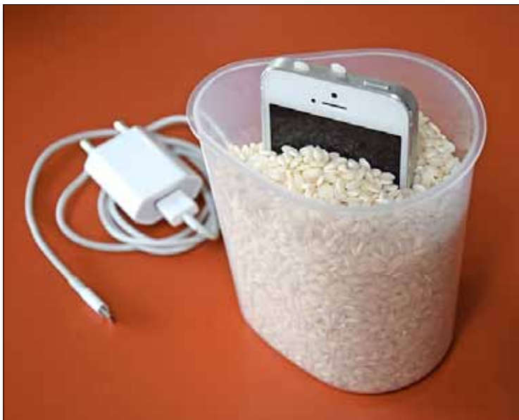
Uw gsm in de soep laten vallen? Geen nood, in een potje rijst krijgt u hem snel weer droog.

Veel van die handigheden komen uit de culinaire sfeer. Een heleboel kerstomaatjes tegelijk doorsnijden lukt bijvoorbeeld door ze tussen twee borden te leggen en dan met een scherp