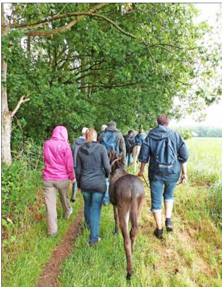
De vrijwilligers en vrienden van het opvangcentrum wandelen geregeld met de ezels.

Meer weten? Bel 0477 69 38 16 of surf naar www.anegria.be .