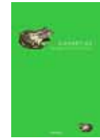
Dit cursiefje werd geplukt uit Opkikkertjes (Halewijn, Antwerpen, 2006). Het boek is inmiddels uitverkocht bij de uitgever.

lachen zullen onze kinderen immers verzuuren, wat als een bijtend middel hun onschuld en levendigheid vernietigt.