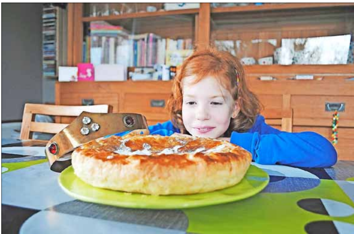
Wie vindt straks de boon in de taart en mag een eigen hofhouding aanstellen?

Kuifje , nog tot 16 april in Train World (station Schaarbeek, Prinses Elisabethplein 5). Open dinsdag tot zondag van 10 tot 17 uur. Tickets kosten 10 en 7,50 euro. Info: www.trainworld.be , 02 224 74 98.