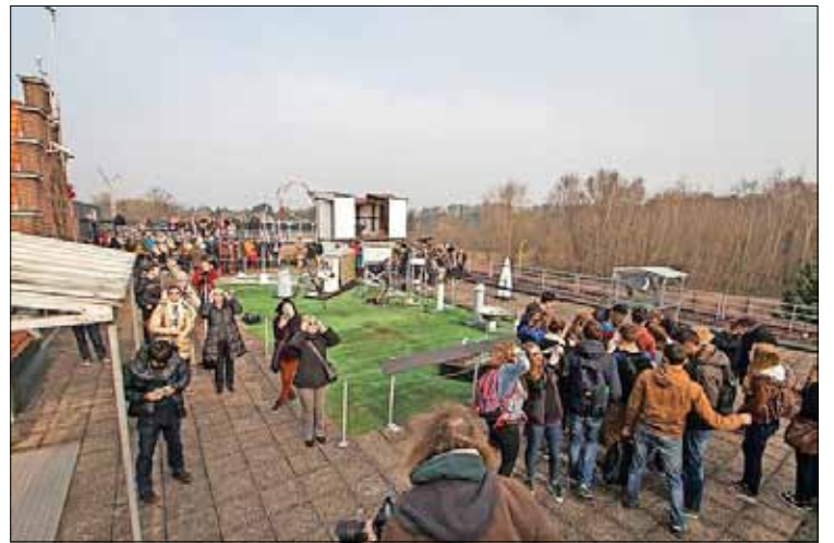
Grote hemelfenomenen, zoals een maansverduistering, lokken veel volk naar het terras van Mira.

die uitleg geven over alle aspecten van sterrenkunde, ruimtevaart en weerkunde. „Hier komt geen onderhoudsfirma binnen, behalve dan voor de lift”, lacht Eycken. Vaak hebben de vrijwilligers ook een specialisatie. Mollet: „Er zijn kenners van de maan, de zon en van veranderlijke sterren. Een vrouw die jarenlang meedraaide, maakte schitterende tekeningen van maan-