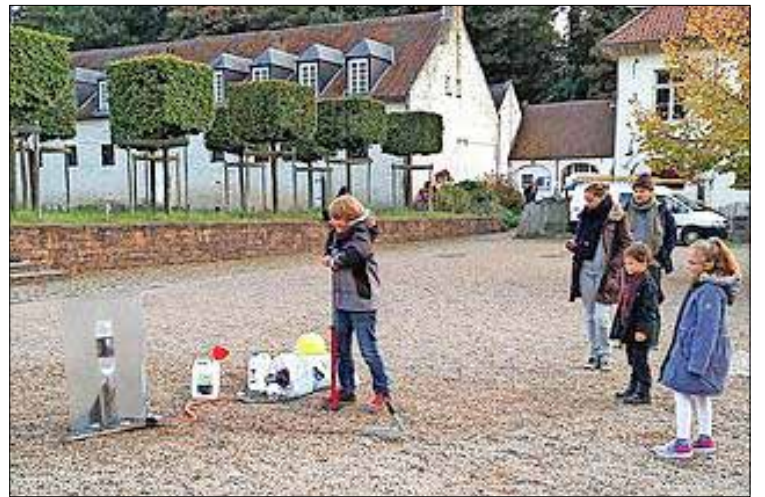
De Jeugdkern lanceert waterraketten in de tuin van de norbertijnenabdij in Grimbergen.

Vrijwilligers zitten aan het onthaal, geven uitleg en maken en onderhouden toestellen en installaties voor de diverse ruimtes