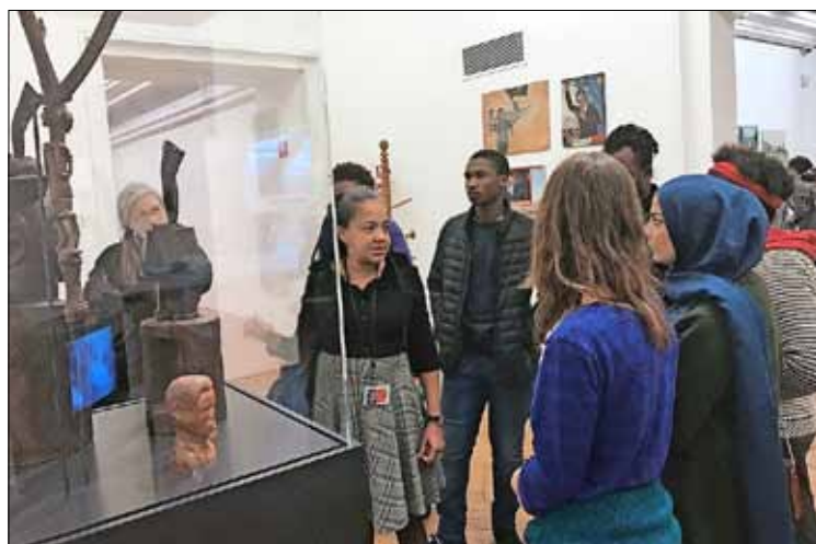
In het museum. Kilalo laat jongeren nadenken en in dialoog gaan over hun dubbele identiteit.

Kilalo ondersteunt kinderen en jongeren echter niet enkel op schoolvlak. De vereniging orga-