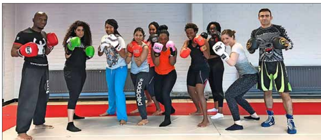
Ontspannende activiteiten, zoals een introductie in de bokssport, zijn een beloning voor de vrijwilligers en voor de kinderen die in de huiswerkklas hard werken.