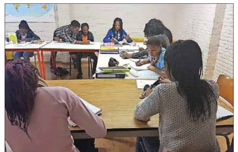
Vragen over het leven zijn bij de vrijwilligers even welkom als vragen over school en huistaken.