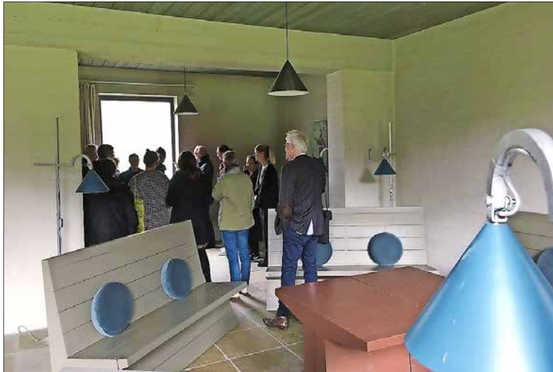
De monnik ontwierp zelfs het meubilair van de abdij Roosenberg. © Vlaams Architectuurinstituut

Van der Laan studeerde bouwkunde in Delft, maar brak zijn studies af om in te treden bij de benedictijnen van de Sint-Paulusabdij in Oosterhout. Daar