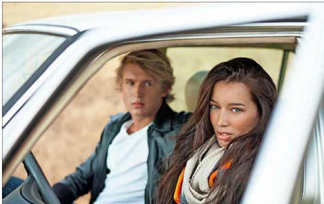
Zij aan zij zitten in de auto bevordert volgens psychologen een goed gesprek.

Lekproblemen en lekdetectie worden vakkundig opgelost door het partner-bedrijf Polygon (0800 96 600 - www.polygongroup.be ).